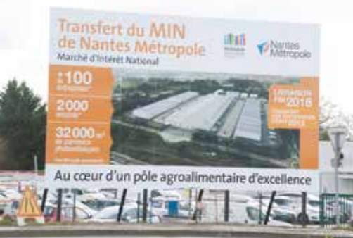
Le M.I.N. accueillera 109 entreprises et 1 200 emplois dans la distribution en gros de produits agricoles, alimentaires et horticoles.

mentales. Les refroidisseurs de liquides sont associés à des aéro-réfrigérants adiabatiques Jacir, ce qui permet de confiner l'ammoniac en salle des machines et d'en limiter la charge à moins de 50 kg par installation. Le froid sera distribué chez les opérateurs par un réseau d'eau glycolée -8°C/-4°C et diffusé grâce aux 350 frigorifères installés dans les chambres froides. Ces choix devraient permettre des économies d'énergie significatives par mutualisation, avec un impact environnemental minimum, l'achat d'électricité groupé et négocié, ainsi qu'une autoconsommation de l'électricité photovoltaïque produite sur le site.