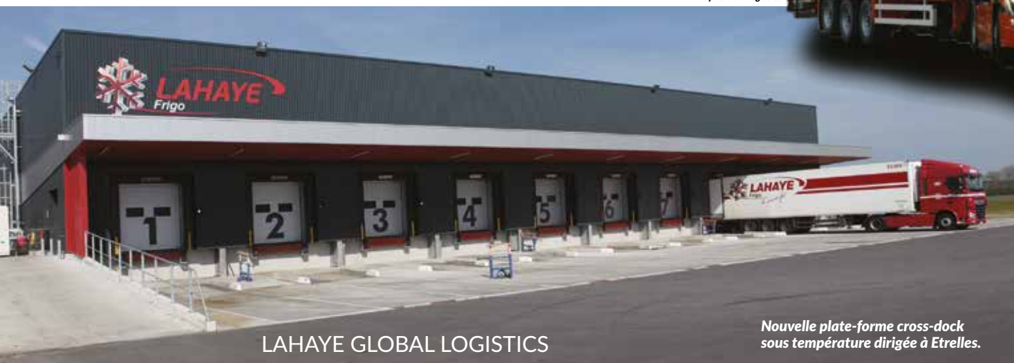
LAHAYE GLOBAL LOGISTICS

Nouvelle plate-forme cross-dock sous température dirigée à Etelles.