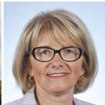
Valérie Lacroute, Députée de Seine-et-Marne.