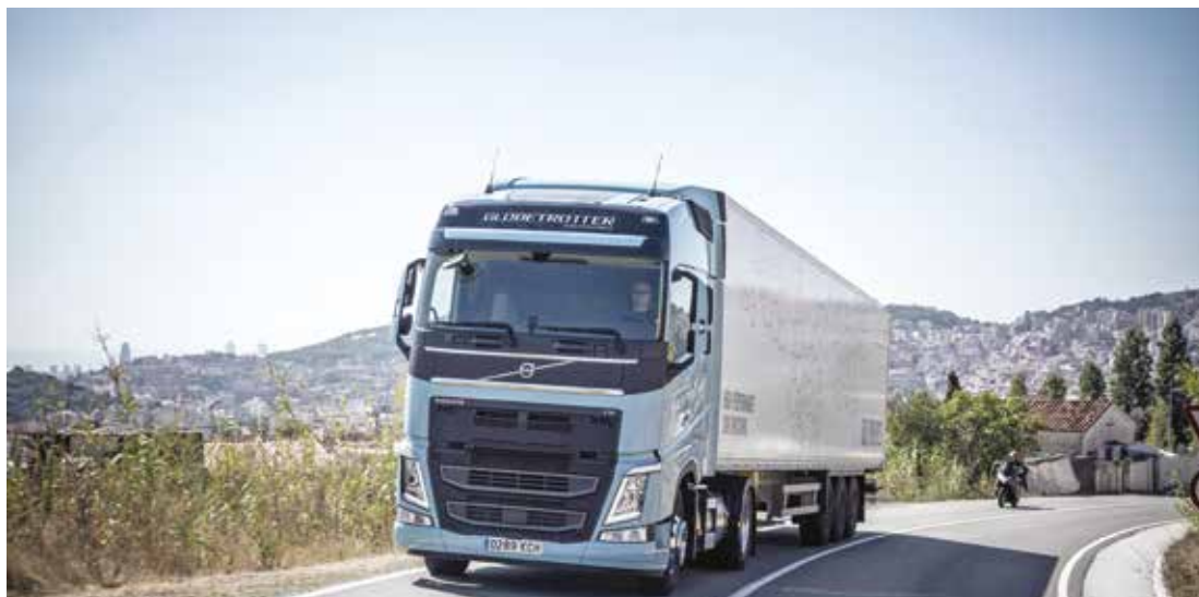
La motorisation Dual Fuel que Volvo commercialisera au printemps nécessite de ravitailler à la fois en gazole, en GNL et en AdBlue

un intérêt en utilisation longue distance car le cycle Diesel réduit la consommation de GNL et celui-ci est aujourd'hui accessible à des prix compétitifs. L'adoption du Dual Fuel est donc le résultat d'un calcul estimant l'économie à réaliser sur le poste carburant dans le TCO.