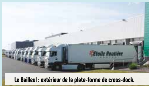
Le Bailleul : extérieur de la plate-forme de cross-dock.

L'entreprise assure la livraison en direct de 80% des plates-formes GMS en flux tendu de produits frais +0°C/+2°C, ainsi que les grossistes et détaillants via des confrères. Les 4 sites traitent plus de 6000 palettes/jour. A noter, d'autres activités : stockage, préparation de commandes, co-packing, empotage de conteneurs en produits frais et surgelés sur les sites de la Flèche, la Ferté-Bernard et Orléans (8500 palettes en frais et 5000 palettes en surgelé). Afin de répondre aux normes environnementales, nos entrepôts sont équipés d'une production