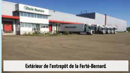
Extérieur de l'entrepôt de la Ferté-Bernard.