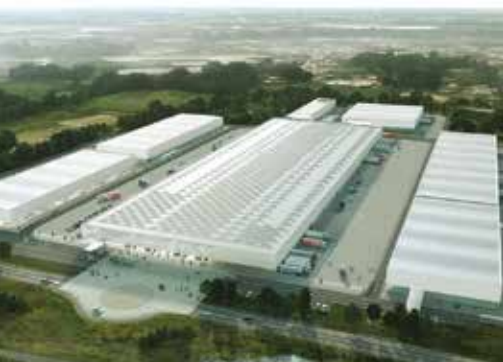
Une image de synthèse du futur M.I.N., conçu par Erik Giudice architecture, qui sera construit à Rezé. Copyright. Erik Giudice Architecture.