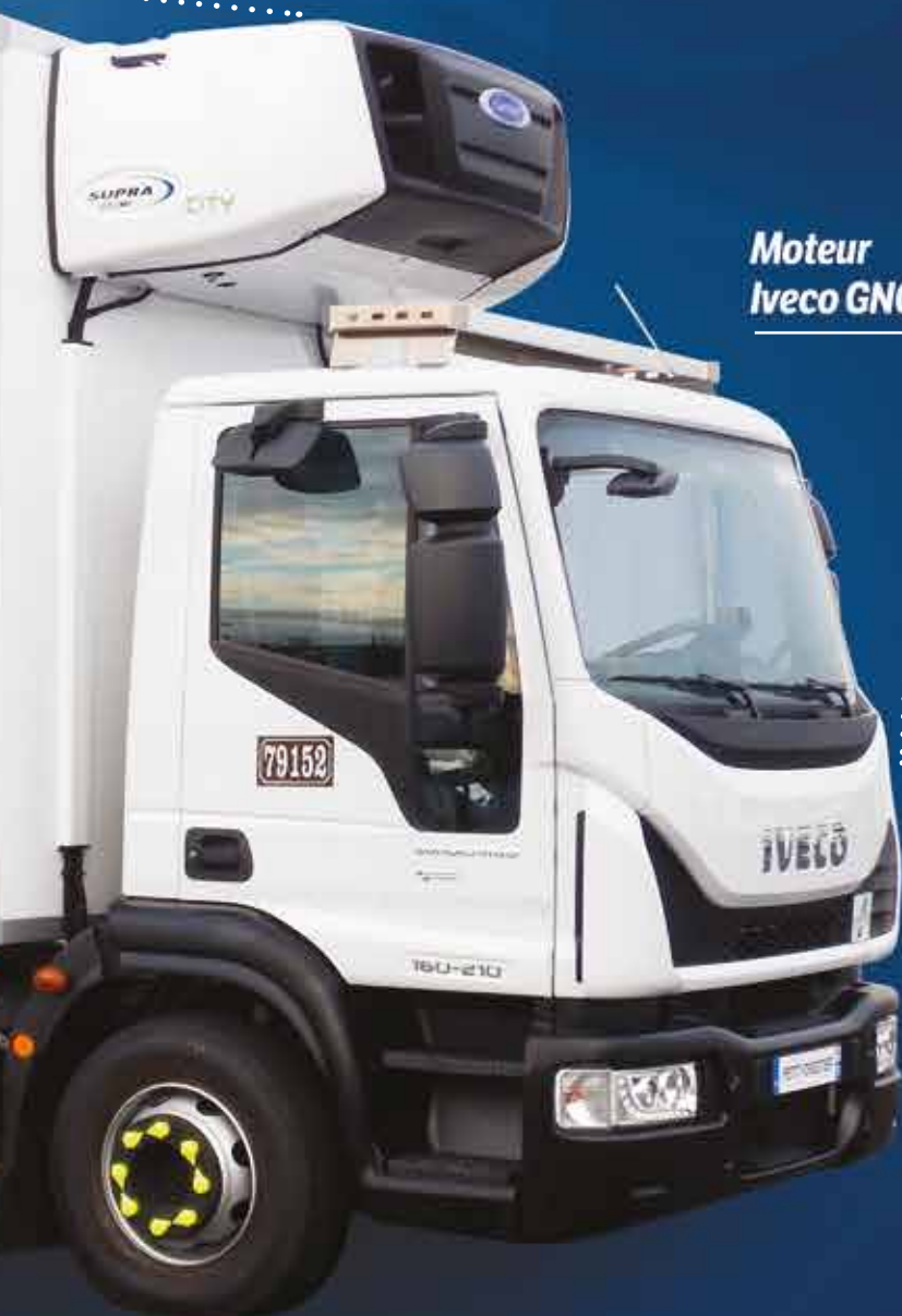
Moteur Iveco GNC

Petit Forestier présente un exemple de son savoir-faire sélectionné dans PODIUM. A noter, les récompenses obtenues à Solutrans : la porte EasyAcc'Air de sa filiale Lecapitaine, primée par un trophée de bronze dans la catégorie Carrossiers Constructeurs, et le groupe Supra Gaz Naturel Comprimé de Carrier Transicold qui a remporté le trophée du développement durable.