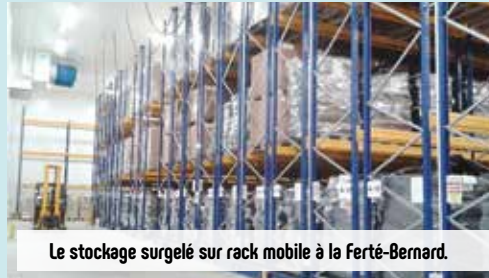
Le stockage surgelé sur rack mobile à la Ferté-Bernard.

L'Étoile Routière reste fidèle à ses origines avec une majeure partie de son activité consacrée aux produits frais carnés. Quoi de plus normal au pays des poulets de Loué et des rillettes.