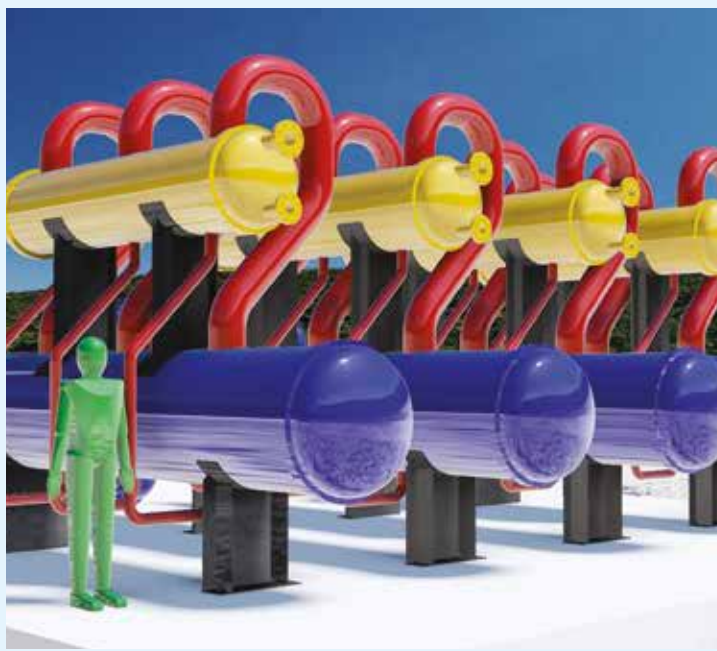
Maquette 3D de la technologie LNGCOLD.

L e GNL comme source de réfrigération ? C'est l'objet du projet breveté par l'entreprise allemande Eco ice Kälte GmbH. Cette technologie récupère le froid du GNL. Celui-ci est alors liquéfié à -162^{\circ}\text{C} pour des raisons de stockage et d'acheminement. Lors de son utilisation, il est re-gazéifié par échange thermique avec l'air ambiant. Le froid s'évapore donc dans la nature. La solution LNGCOLD permet de récupérer cette capacité de froid, sans consommation supplémentaire