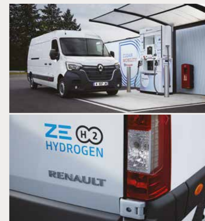
Renault MASTER Z.E. Hydrogen répond aux attentes de tous les métiers souhaitant pénétrer au cœur de la ville.