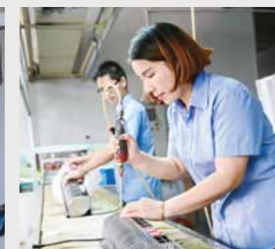
RK Com fabrique le rideau d'air RKair adapté à toutes les carrosseries isothermes quasiment au même prix que des lanières.

30 % DE CARBURANT ÉCONOMISÉ POUR LES VÉHICULES FRIGORIFIQUES