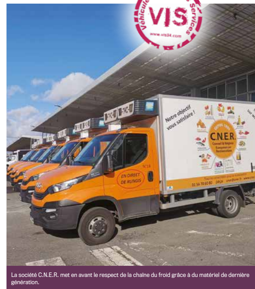
La société C.N.E.R. met en avant le respect de la chaîne du froid grâce à du matériel de dernière génération.

C.N.E.R. (Conseil et Négoce Européen en Restauration) est implantée depuis 20 ans sur le M.I.N. de Rungis en