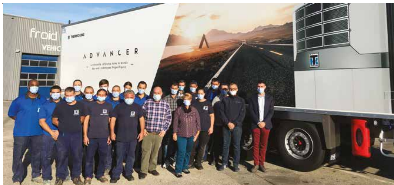
L'agence Froid & Services Méditerranée de Vitrolles, vitrine technologique de Thermo King en mode Covid.