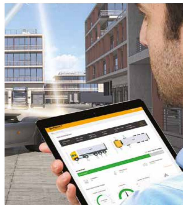
Le contrôle de la charge permet d'exploiter les véhicules de manière efficace, économique et sûre, tout en limitant les trajets à vide.

C ontinental a mis au point un système de pesage embarqué 'On Board Weighing System'. L'OBWS enregistre et affiche le poids des véhicules, avec leur remorque ou semi-remorque, rapidement, facilement, indépendamment d'une balance fixe, et avant le départ du véhicule. Des fonctions supplémentaires permettent d'en augmenter l'efficacité bien au-delà des exigences de la directive UE 2015/719, qui entrera en vigueur en mai 2021. Pour les véhicules à suspension pneumatique, Continental a mis au point un capteur qui utilise les ultrasons pour mesurer la hauteur et la pression des ressorts pneumatiques et déterminer l'état de charge de l'essieu. Un capteur de hauteur a également été développé pour les amortisseurs des véhicules à suspension non pneumatique. Enfin, cette solution fondée sur les données est la base de la maintenance préventive et de nouveaux modèles commerciaux. ■